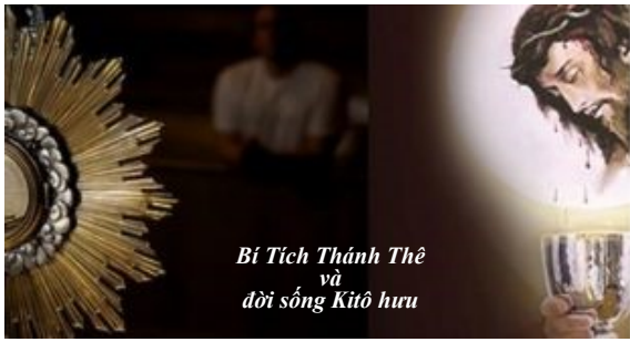
Bí Tích Thánh Thể và đời sống Kitô hữu