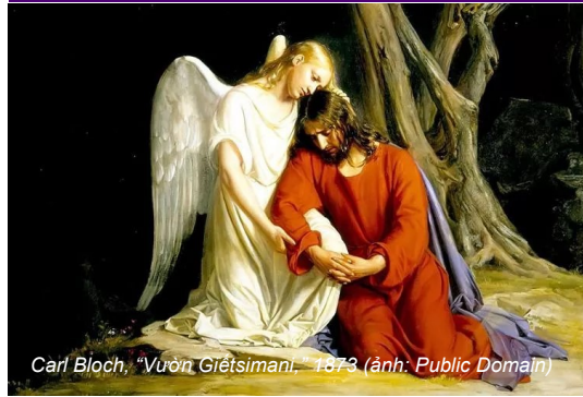
Carl Bloch, "Vườn Giếtsimani," 1873