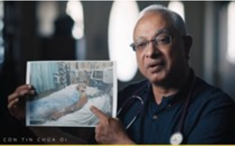
1 BÁC SĨ NGỪNG TIM 85 PHÚT ĐƯỢC CỨU SỐNG NHỜ LỜI CẦU NGUYỆN CỦA VỢ VỚI THIÊN CHÚA

Một câu chuyện có thật tại Úc khiến nhiều người không khỏi xúc động.